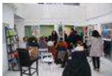
La Ruche coworking Marseille

A la recherche active d'un espace pour héberger les premiers membres de la communauté... 100 à 200 m 2 pour partager des projets, des ateliers, ... profiter d'une formation.